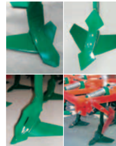
VN TerraMix med bredskær (v. yd.), dobbelt hjertesvær (h. yd.) eller knivskær (v.ned.). Stensikring via spiralfjedre (NON-STOP, h. ned.)

Seriemæssigt udstyret med Terrapak-valse, herved sønderdeles jorden perfekt og ved kileringene og afstrygermederne gives en utrolig overbevisende genbefæstigelse. Selve trykket fra afstrygermederne er stilbart, i forhold til de forskellige krav der er til genbefæstigelse. Rensevirkningen bibeholdes konstant. Ved skærsystemerne er det gennemgående vingskær med 480 mm bredde standard. Agresivitetvinklen er stilbar og yder også god søgning på hårde jorde. Efter ønske kan VN TerraMix leveres med dobbelt hjertesvær for hårdere, eller med knivskær for svære jorde, evt. også med todelt skærsystem.