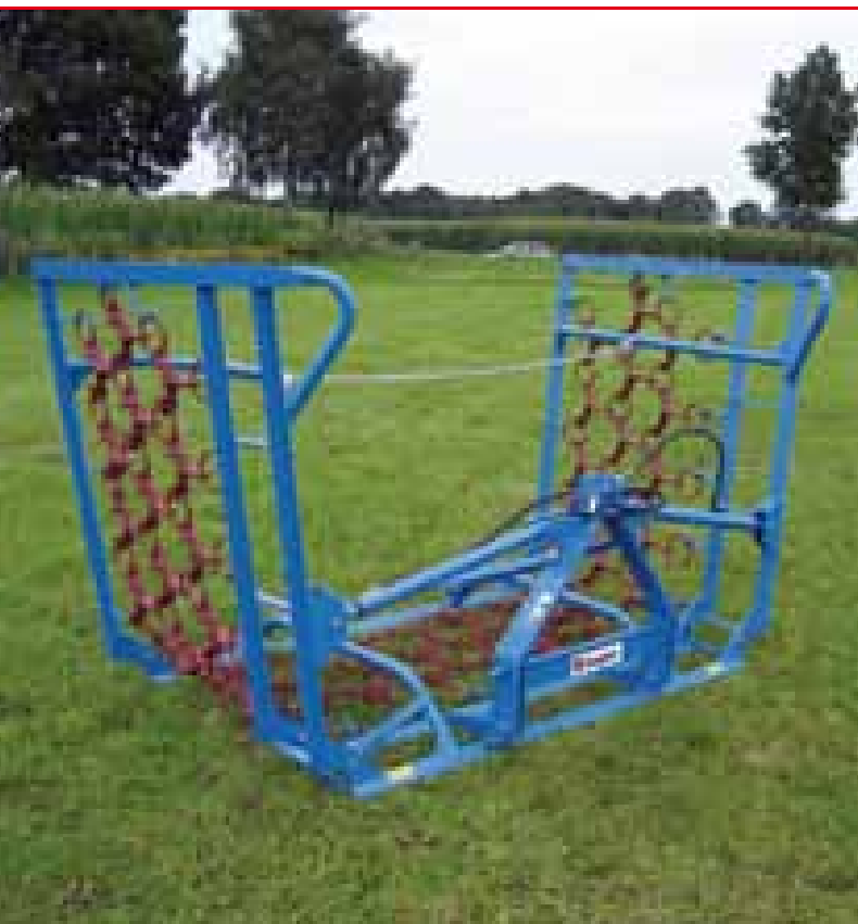
Foto: Perfekt 500W med hydraulisk løft

Perfekt W har stjernerne i 3 rækker, og er med lukket ramme.