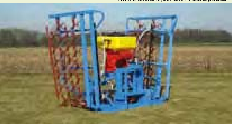
Foto.: Perfekt 600S4 Hydro med APV eftersåningsredskab

S-stjernerne kan bruges på begge sider: Til luftning af græsarealer eller til slæbning.