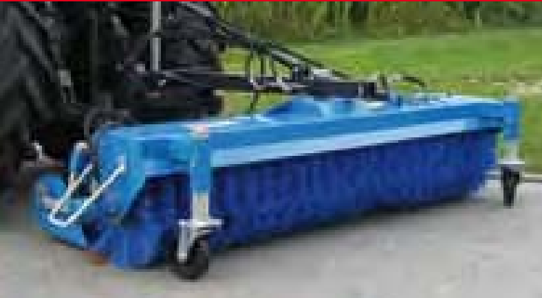
Foto: FKM 231 med ekstraudstyr, tømning og sving

En stor opsamlekasse er standard. Opsamlekassen tømmes via snortræk fra kabinen.