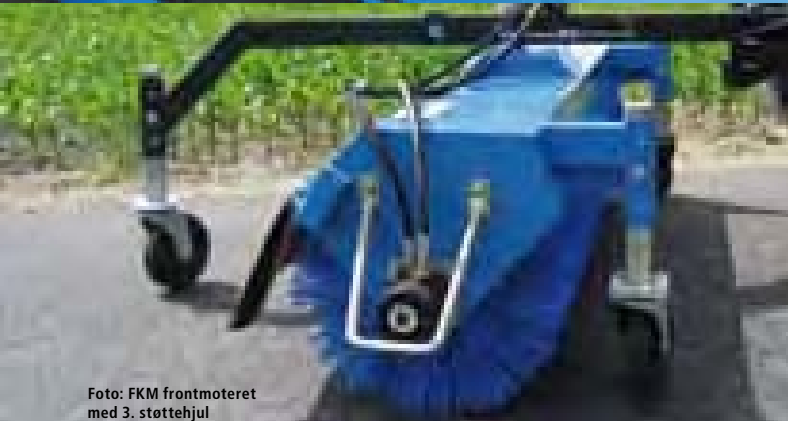
Foto: FKM frontmonteret med 3. støttehjul

Til frontmontering skal der anvendes et 3. støttehjul, dette fås i to forskellige dimensioner. Maskinen kan i frontmontering bruges uden opsamlekasse.