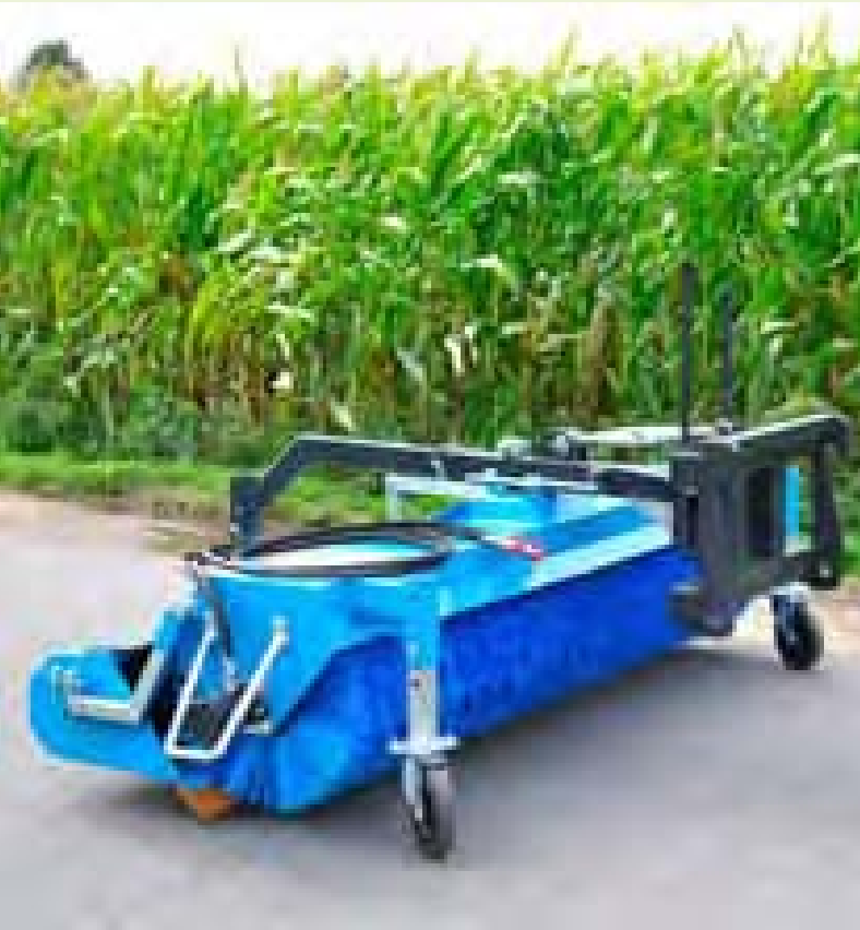
Foto: GKM 231 med tilkobling Weidemann læsemaskine

Det standard medlevered 3. støttehjul kan også leveres i en større model: 250x60 mm.