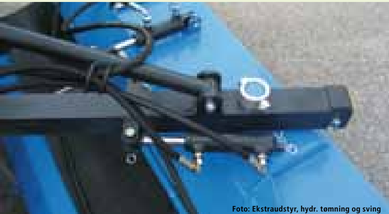
Foto: Ekstraudstyr, hydr. tømning og sving