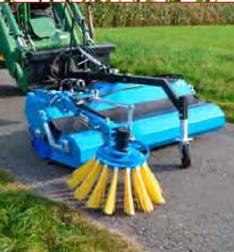
Foto: GKM 231 med Euro-Norm tilkobling, sidekost og hydraulisk tømning